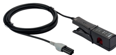
ZANGENSTROMWANDLER MINI 94

Der Zangenstromwandler Mini94 ermöglicht die Messung von Wechselstrom von 50 mA bis 200 A ohne Eingriff in die Anlagen (keine Unterbrechung des zu messenden Stroms). Aufgrund seiner hervorragenden Genauigkeit (Verstärkung und Phasenverschiebung/Genauigkeitsklasse 0,2) eignet er sich besonders für Strommessungen mit Leistungs- und Energieanalysatoren. Er kann unter anderem zur Überprüfung von Energiezählern herangezogen werden.